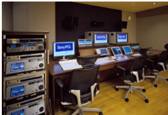
リニア/ノンリニア編集の機能を融合させた「205 ハイブリッド編集室」